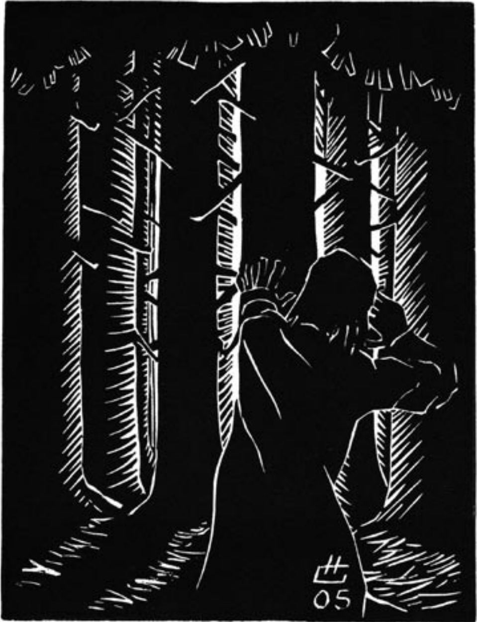
Verirrt im Wald